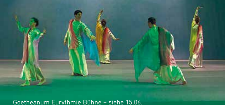
Goetheanum Eurythmie Bühne – siehe 15.06.