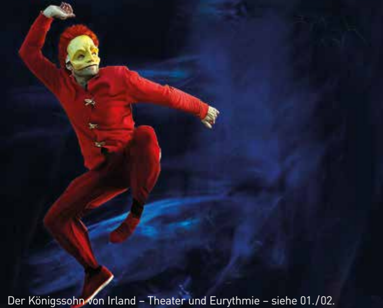
Der Königssohn von Irland – Theater und Eurythmie – siehe 01./02.